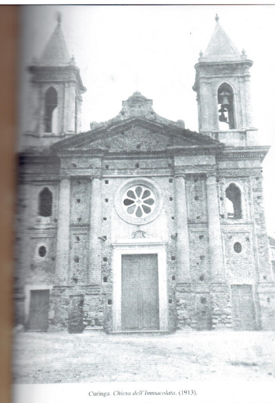
Curinga. Chiesa dell'Immacolata. (1913).

la) ora Piazza Immacolata . Le prime notizie della sua esistenza tratte dal Regesto Vaticano di Padre Francesco Russo risalgono al 1593. Si trattava certamente di una piccola cappella ad una navata che nel corso dei secoli tra terremoti e ricostruzioni cominciava a prendere forma. Ricordiamo, per inciso, il terremoto disastroso del 1783 che solo a Curinga e contrade provocò 78 morti, oltre a ingentissimi