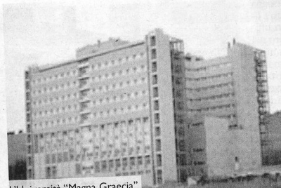
L'Università "Magna Graecia"

operare in ambienti dove spesso è prevalsa la falsità, l'ipocrisia e il menefreghismo, ma nonostante ciò non